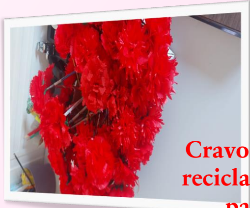
Cravos feitos reciclagem de papel