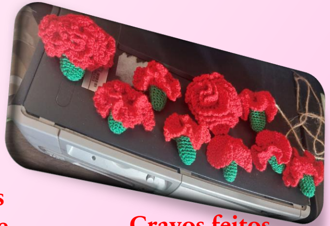
Cravos feitos em croché